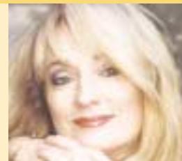
Highlight des Tages: Veronika Fischer & Band