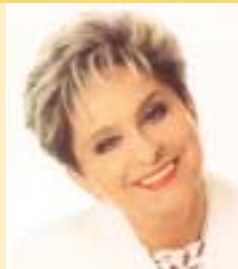
Highlight des Tages: „Tausend Farben, tausend Düfte“ Konzert mit Dagmar Frederic