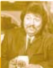
Highlight des Tages: Achim Mentzel