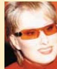
Highlight des Tages: Corinna May, Deutsche Teilnehmerin am „Grand Prix d' Eurovision de la Chanson“